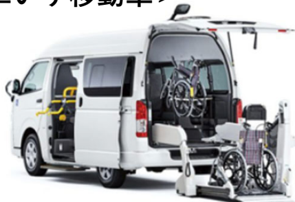
トヨタ ハイエース車いす仕様車