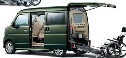
スズキ エブリイ 車いす移動車