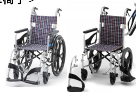
日進医療器 Nツアラー