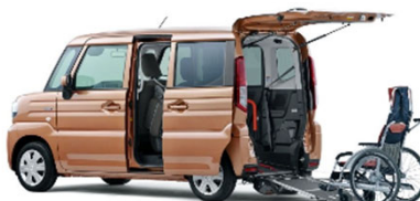
スズキ スペーシア 車いす移動車