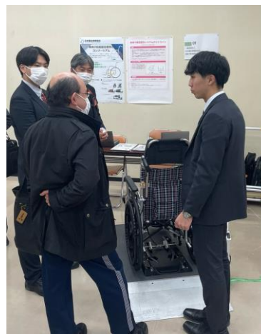
固定装置展示状況(三重)