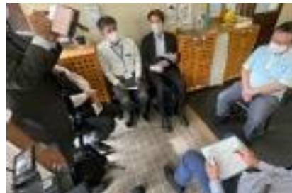
実証実験終了日に 供試品メーカー 同席で施設責任者 等と座談会を実施